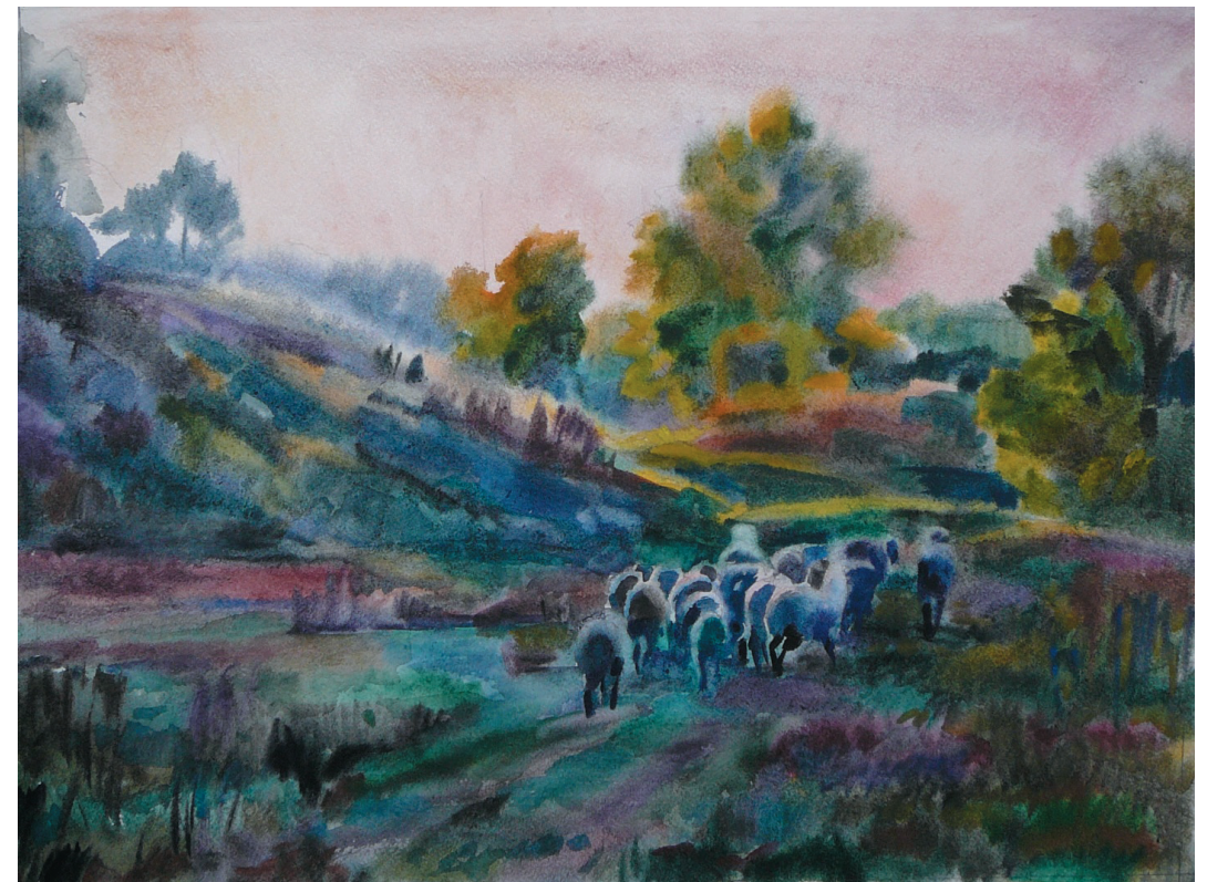
Утро. Бум., акв. 38x51. 2014 г.