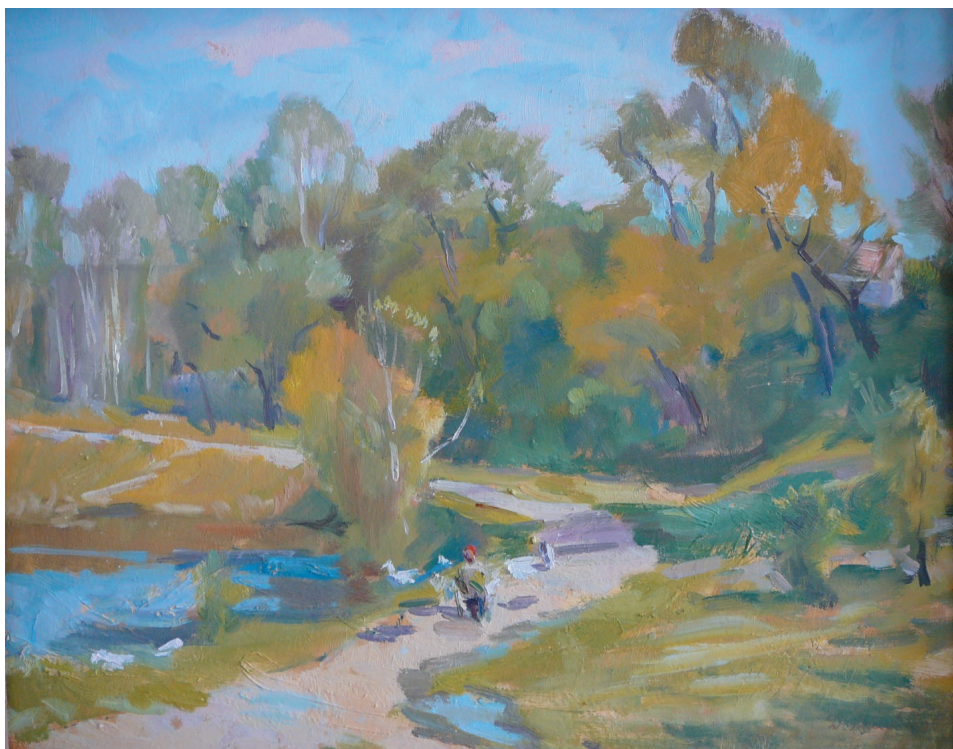
Первая зелень. К., м. 40x50. 1999 г.