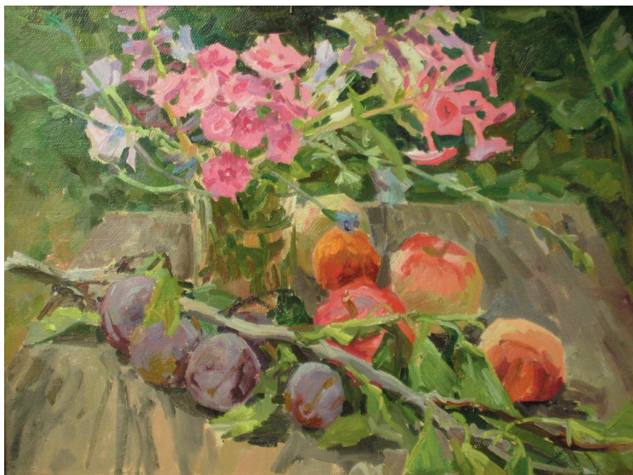
Ветка сливы. К., м. 34x42. 2014 г.