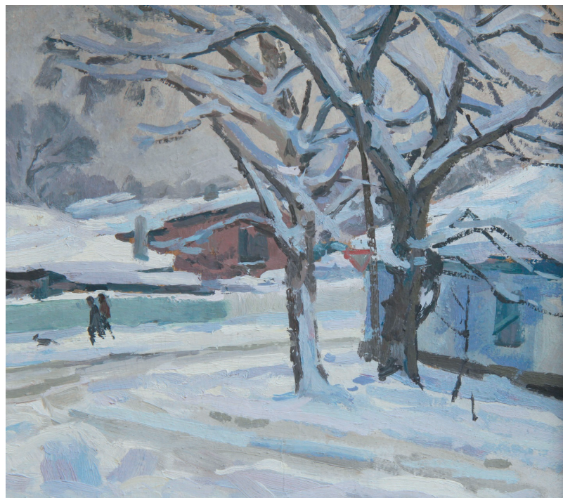
По ул. Пушкина. К., м. 27x24. 2001 г.