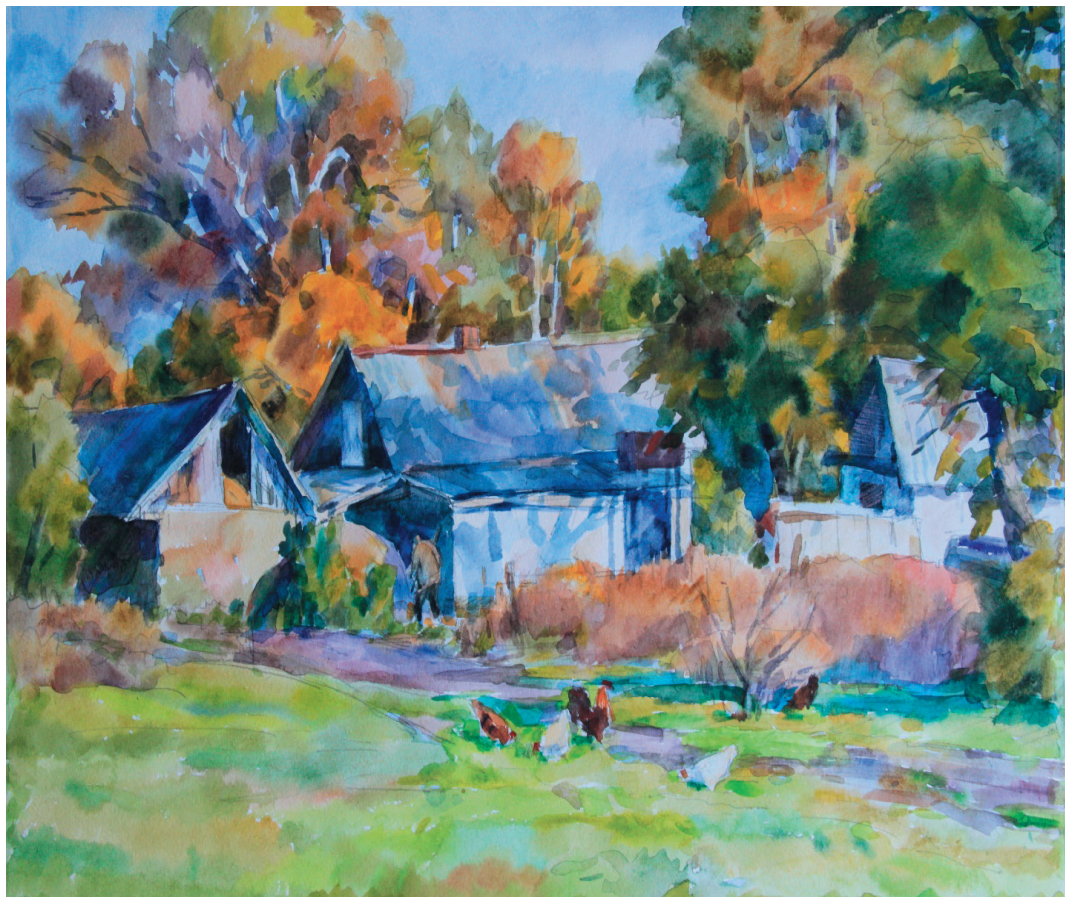
Октябрь. Бум., акв. 35x48. 2010 г.