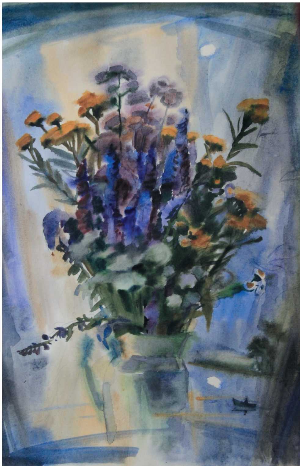
На рассвете. Бум., акв. 42x60. 2019 г.