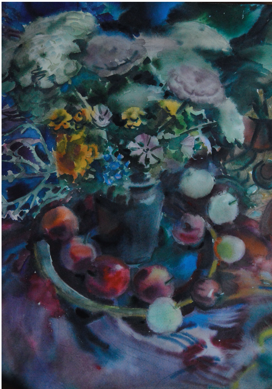
Натюрморт с яблоками. Бум., акв. 54x42. 2015 г.