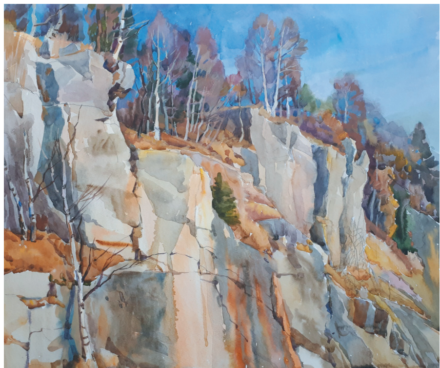
Скалы. Бум., акв. 47x56. 2019 г.