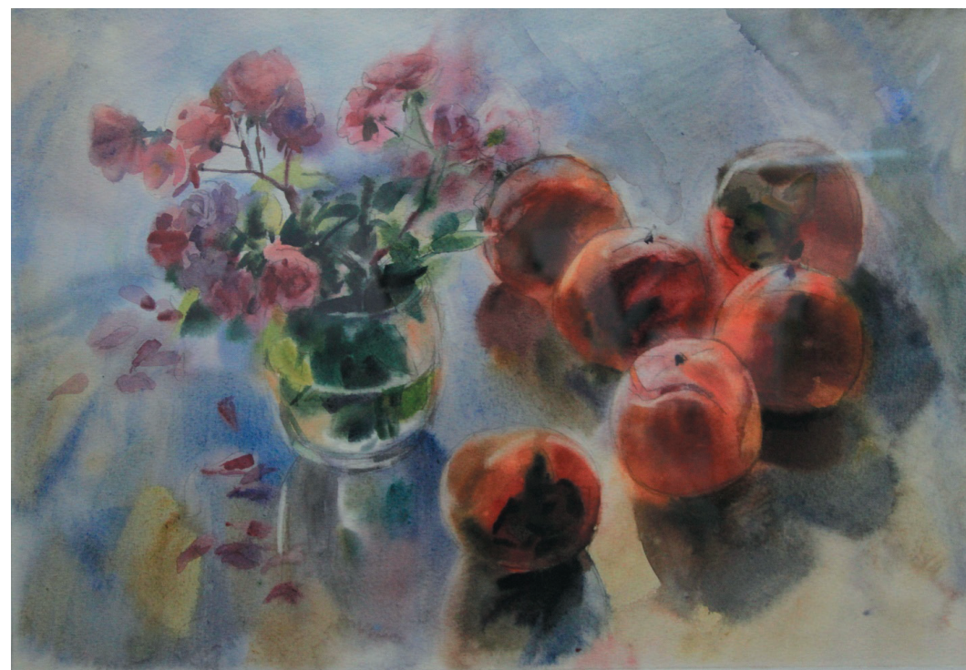
Хурма. Бум., акв. 40x55. 2003 г.