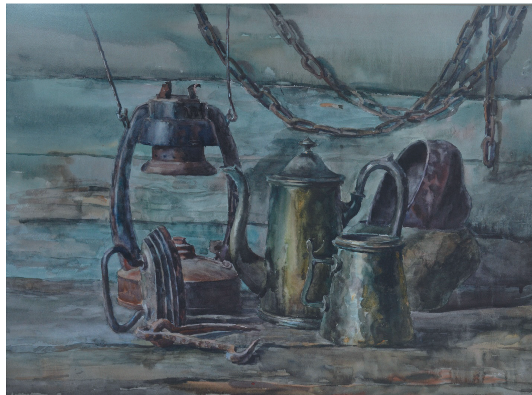
Старые вещи. Бум., акв. 51x70. 2016 г.