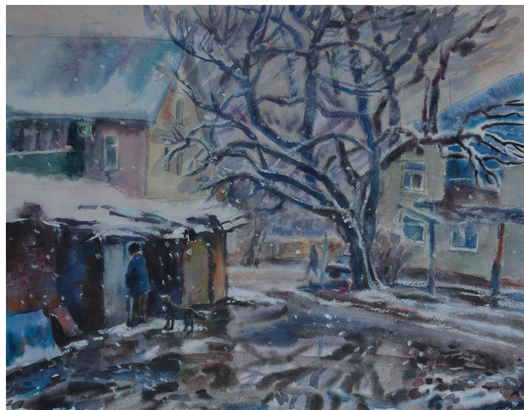
8 Марта. Бум., акв. 38x48. 2012 г.