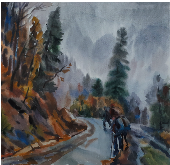
Непогода. Бум., акв. 38x39. 2016 г.