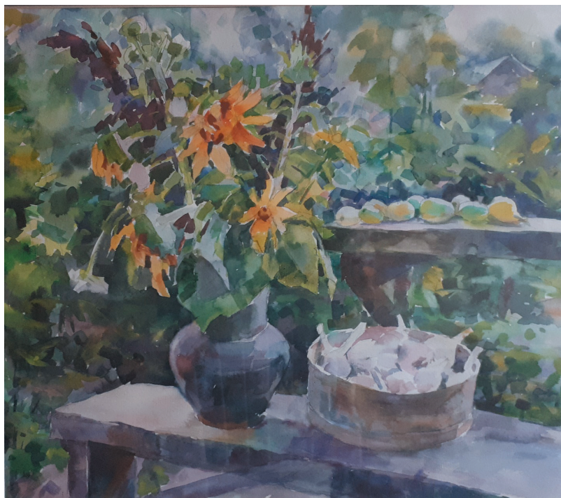
В саду. Бум., акв. 37x45. 2012 г.