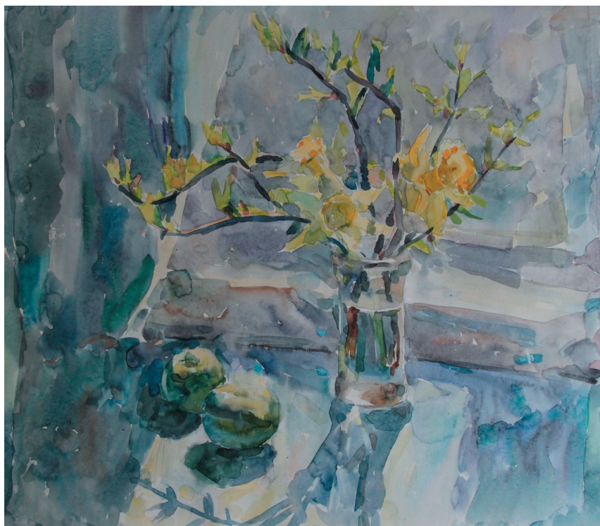
Весенний этюд. Бум., акв. 40x45. 1993 г.