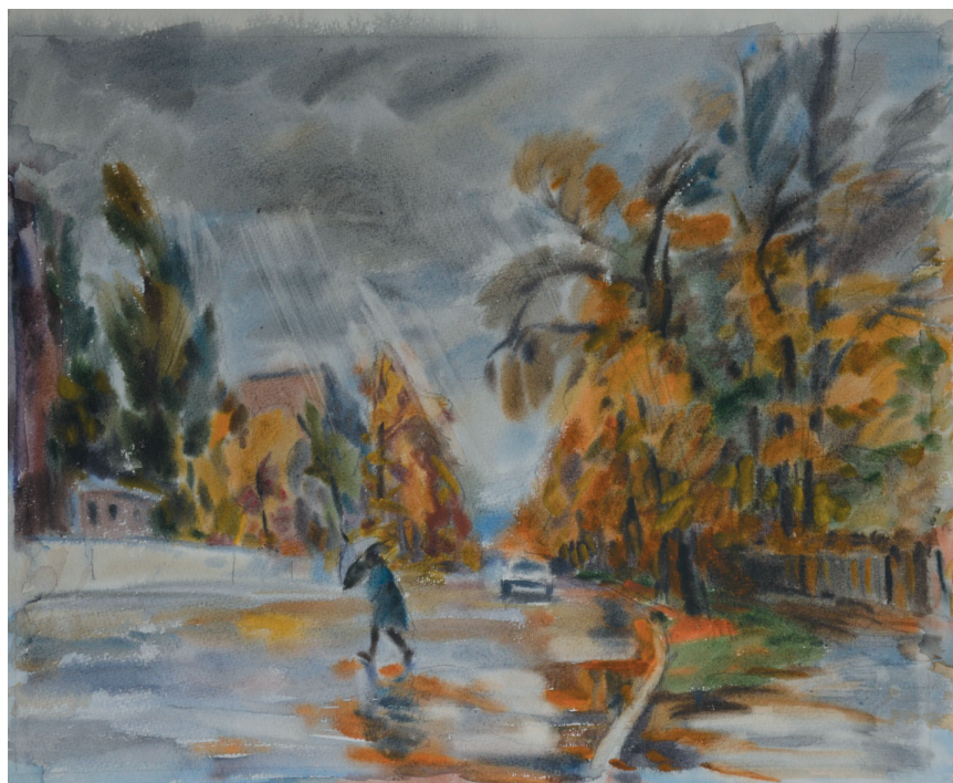
Дождливый день. Бум., акв. 45x50. 1999 г.