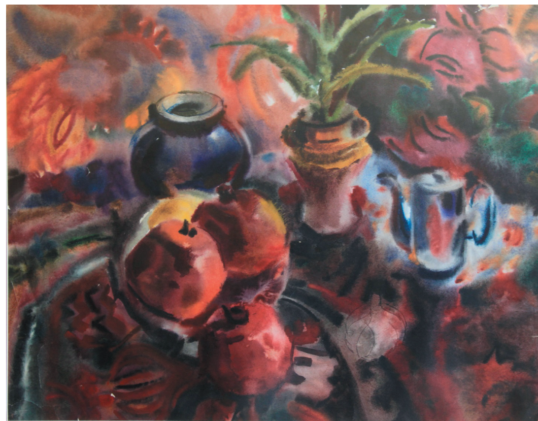
Гранаты. Бум., акв. 50x62. 2004 г.