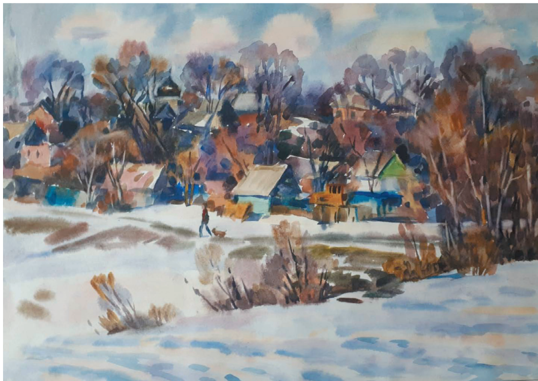
Теплый день. Бум., акв. 45x65.