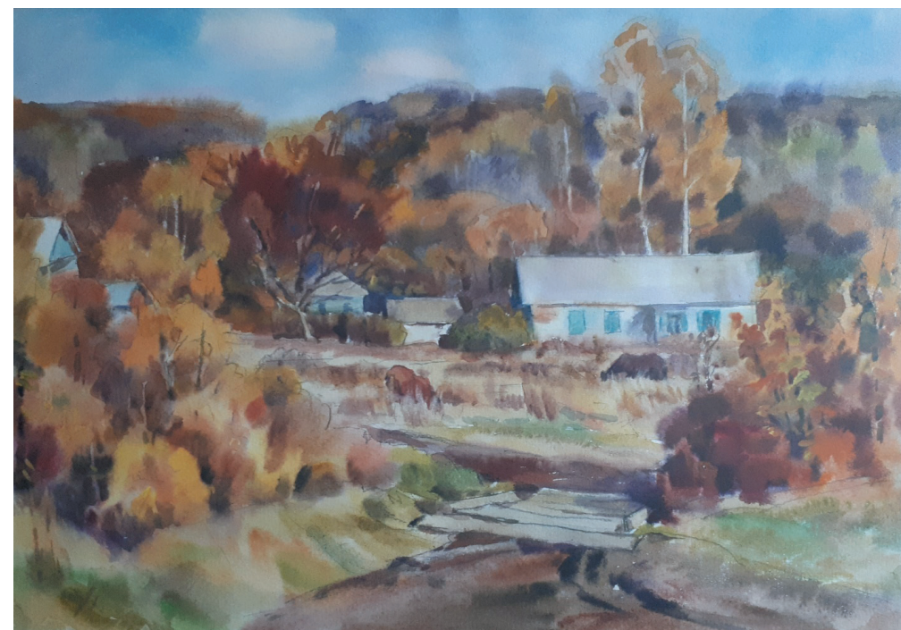
Осень в станице Кужорская. Бум., акв. 40x52. 2000 г.