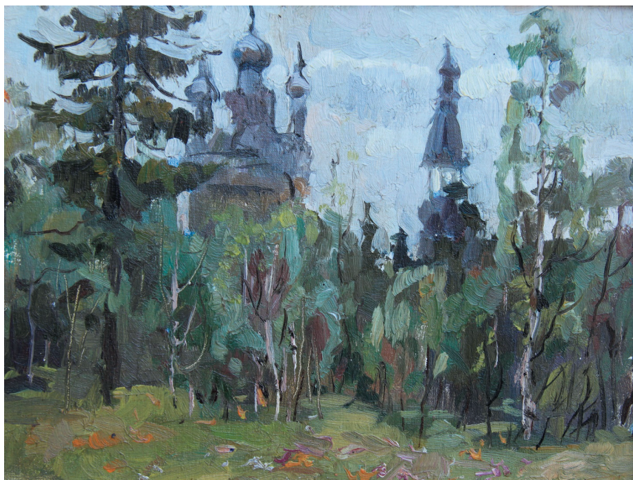
Этюд. К., м. 30x40. 1993 г.