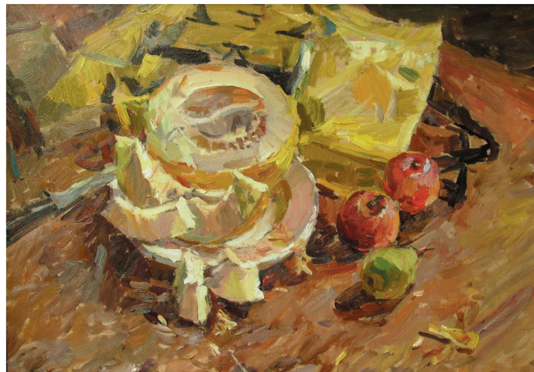
Натюрморт. К., м. 40x60. 2007 г.