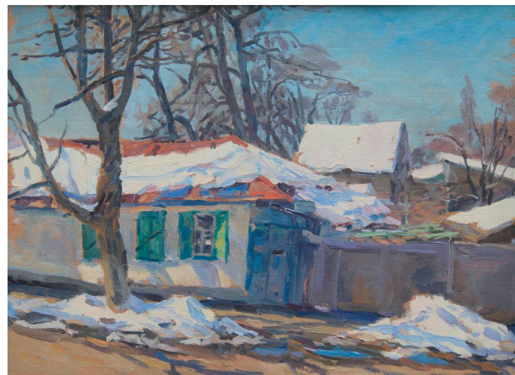
Февральские окна. К., м. 35x43. 2000 г.