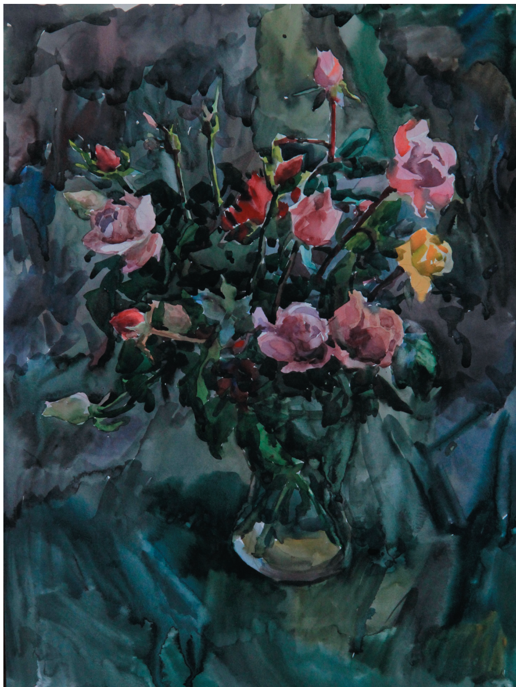
Зимние розы. Бум., акв. 50x38. 2018 г.