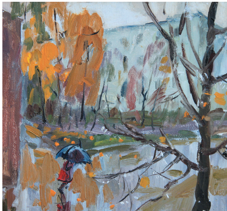
Городок ЦКЗ. К., м. 29x27. 2000 г.