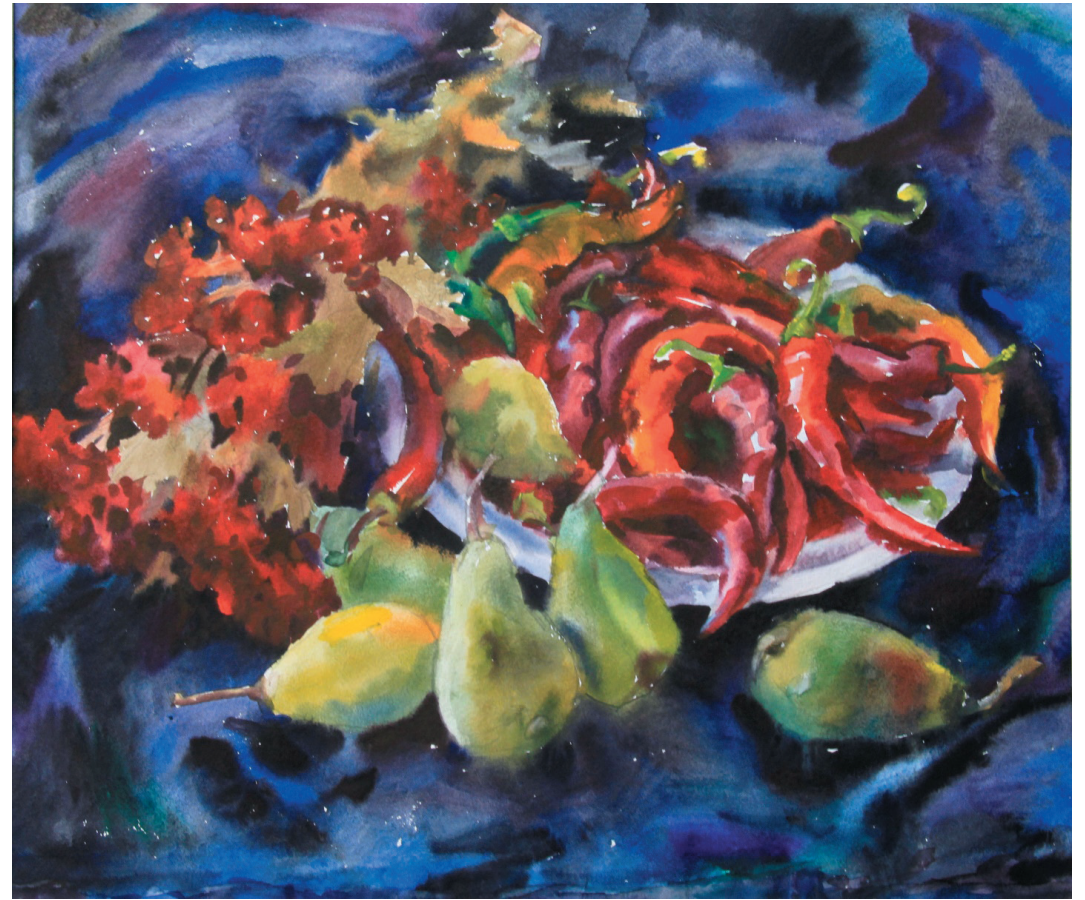
Краски осени. Бум., акв. 41x60. 2010 г.