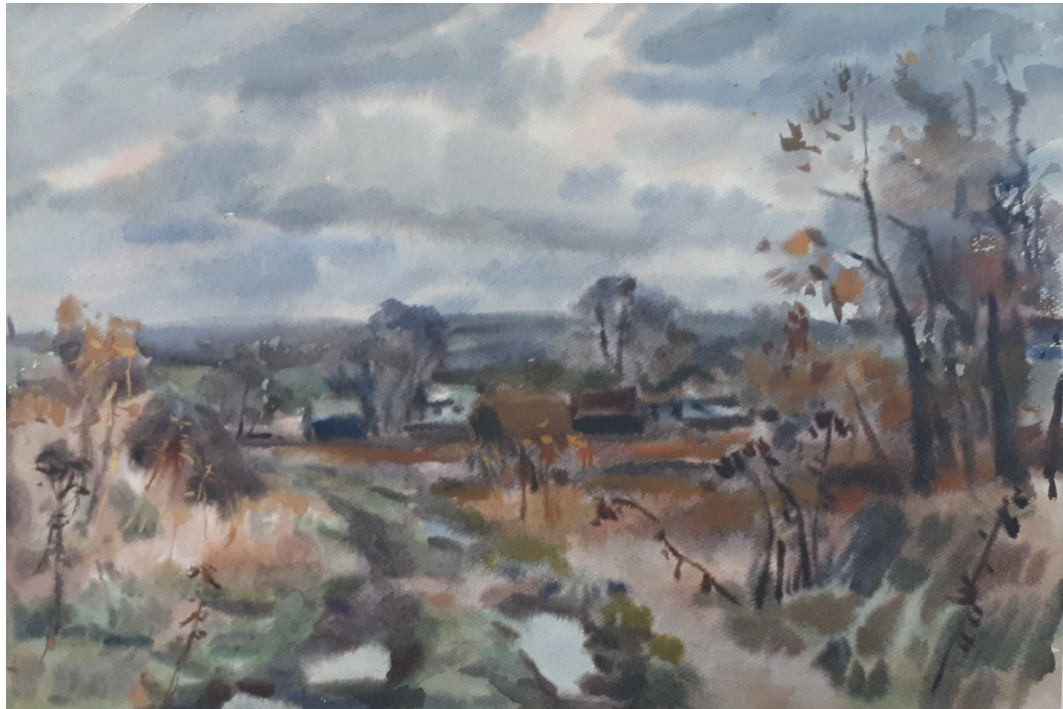
Поздняя осень. Бум., акв. 40x59. 2012 г.