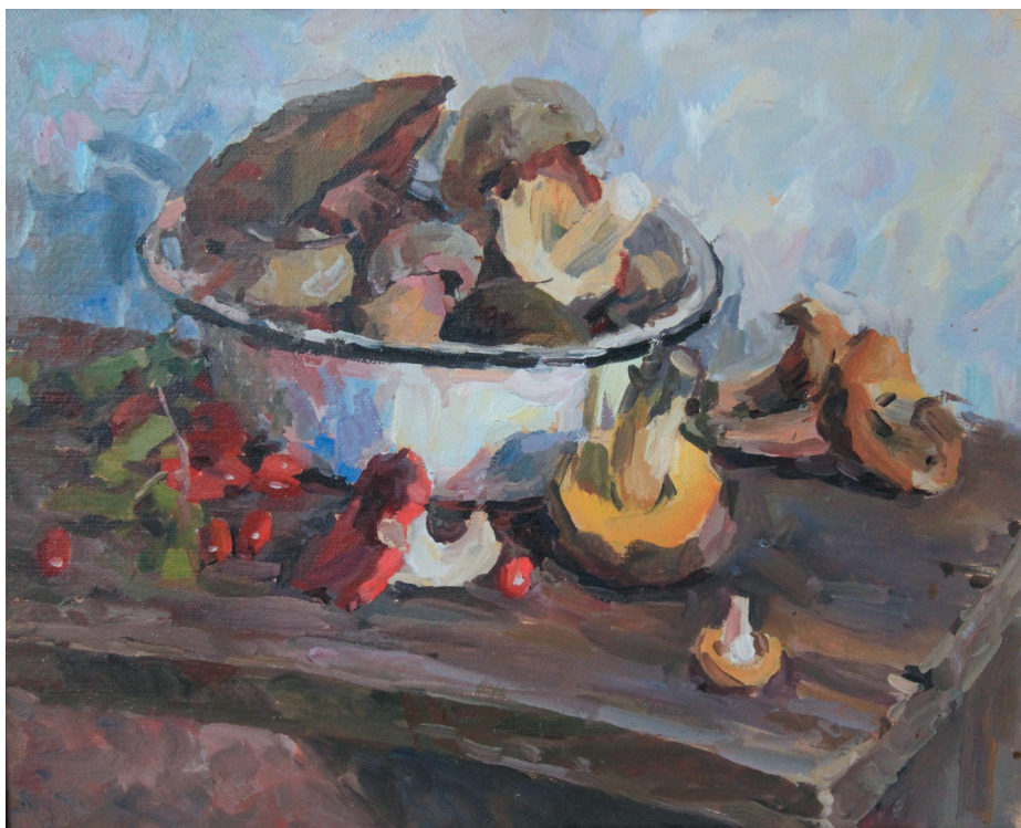
Грибы. К., м. 44x45. 2000 г.