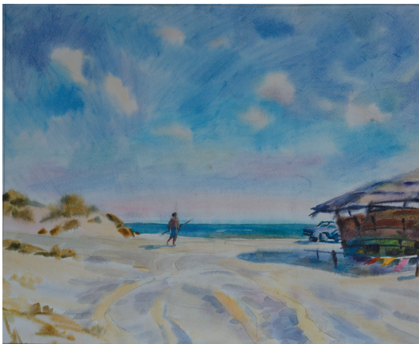
Диари. Бум., акв. 45x55. 2003 г.