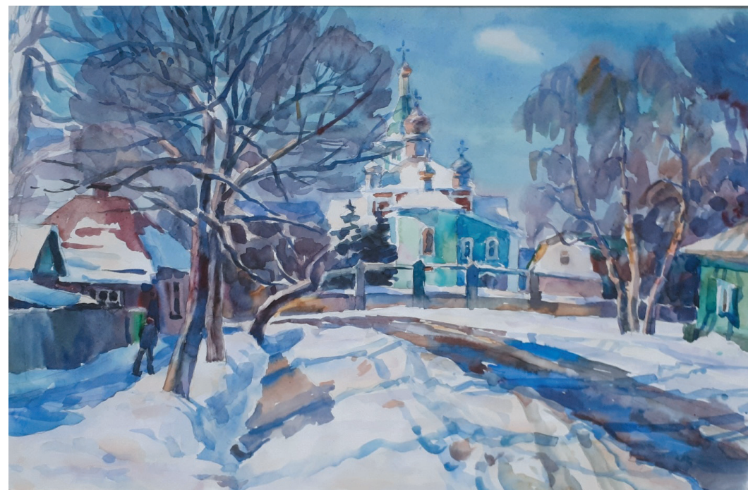
Старый Майкоп. Бум., акв. 38x56. 2010 г.