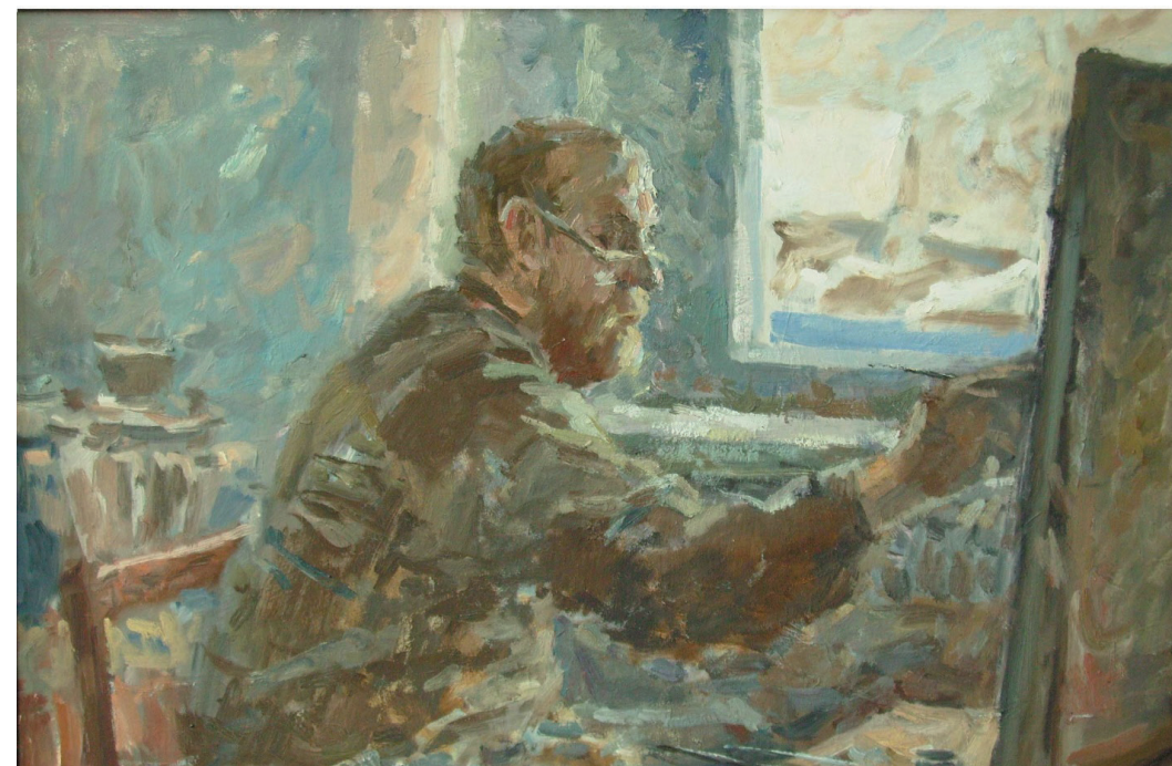
В мастерской. К., м. 50x70. 2003 г.