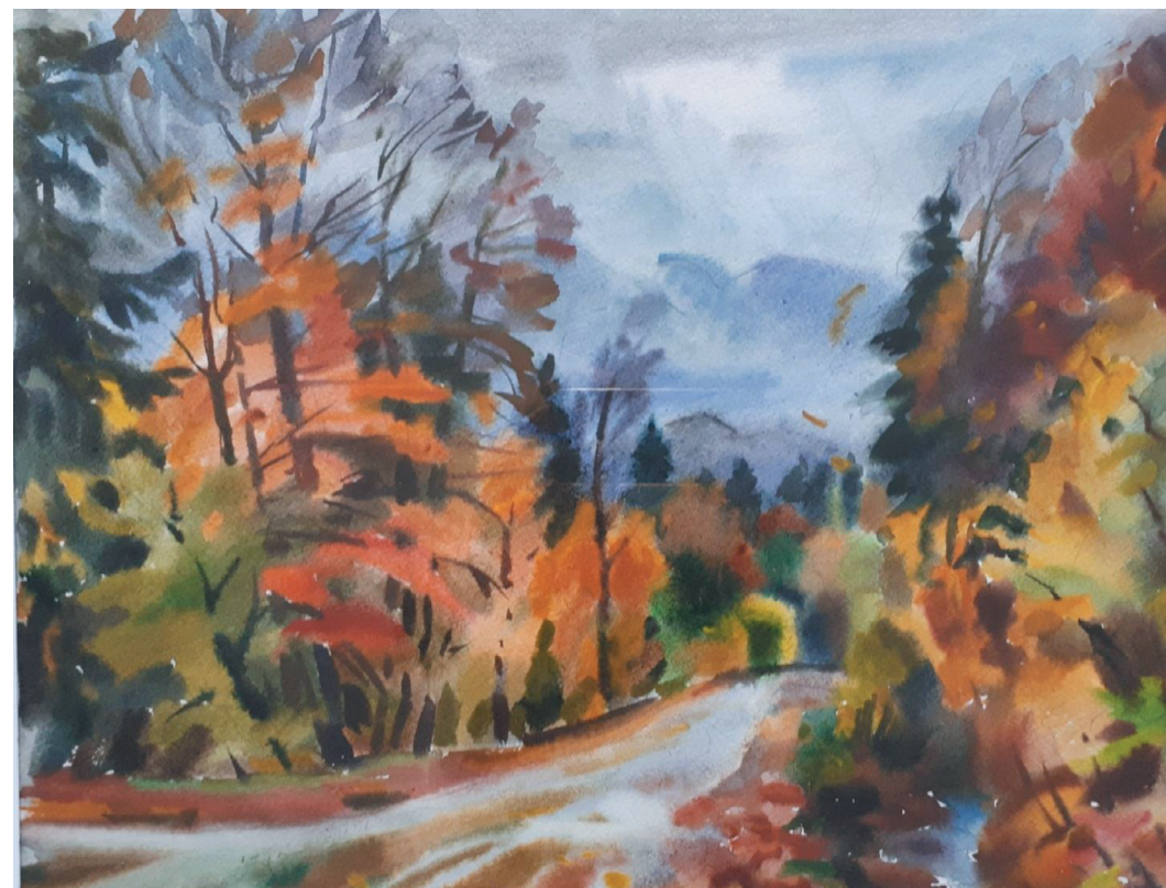
Осенний мотив. Бум., акв. 50x62. 2017 г.