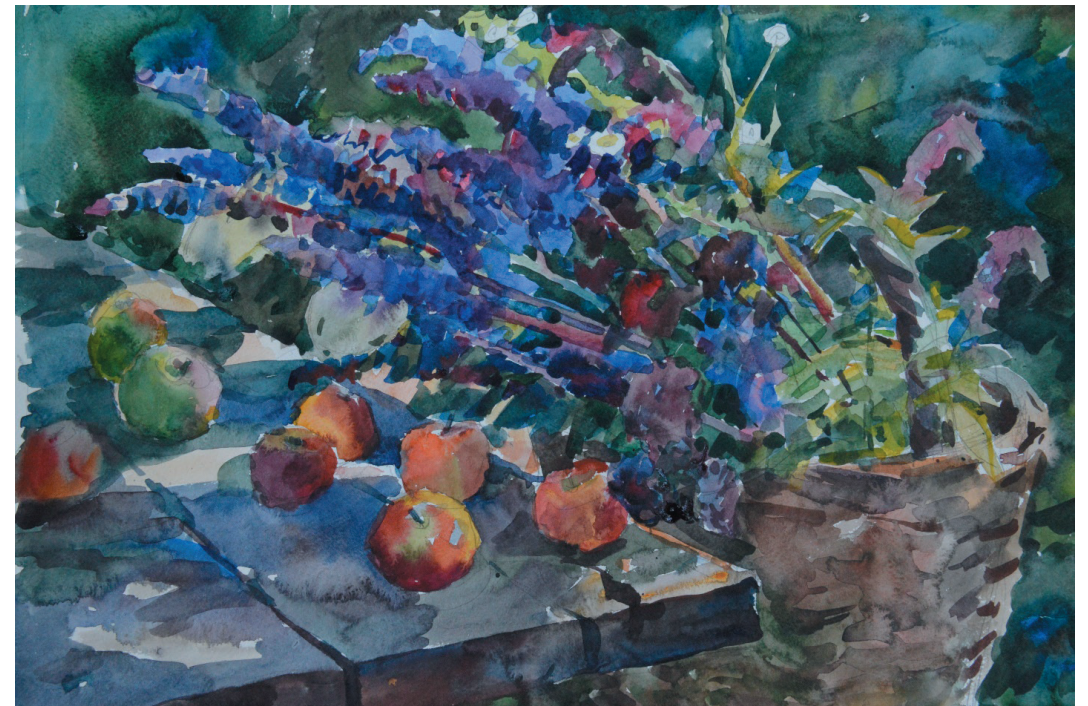
В саду. Бум., акв. 39x57. 2011 г.