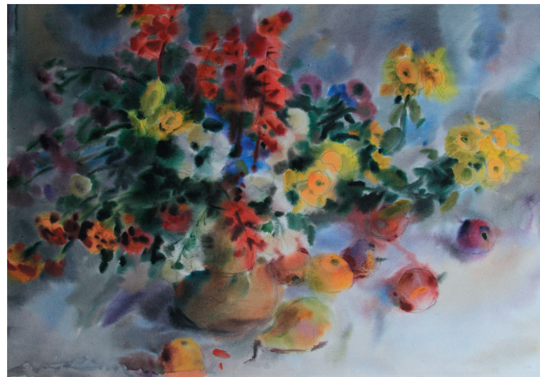
Букет. Бум., акв. 43x65. 2009 г.