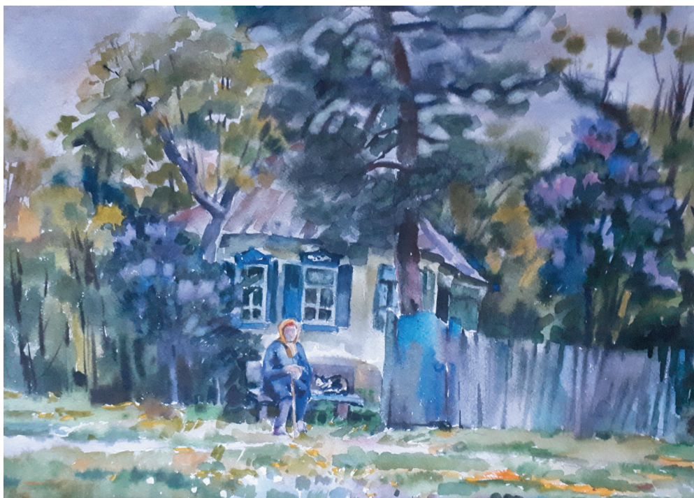
Май. Бум., акв. 37x49. 2009 г.