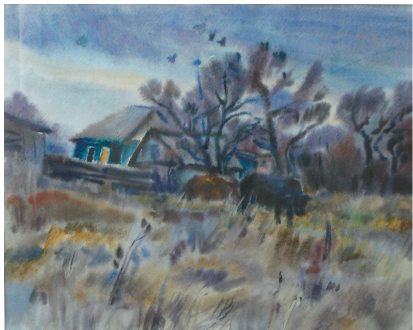
Серый день. Бум., акв. 37x45. 2013 г.