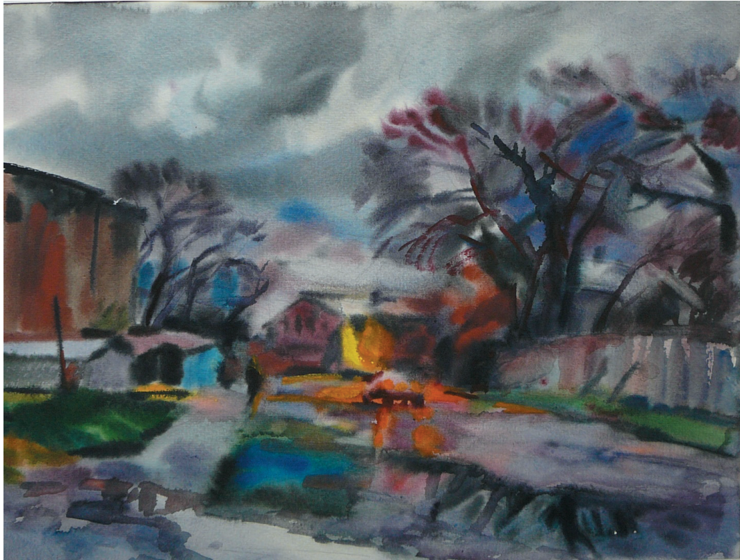
Сумерки. Бум., акв. 33x43. 2015 г.