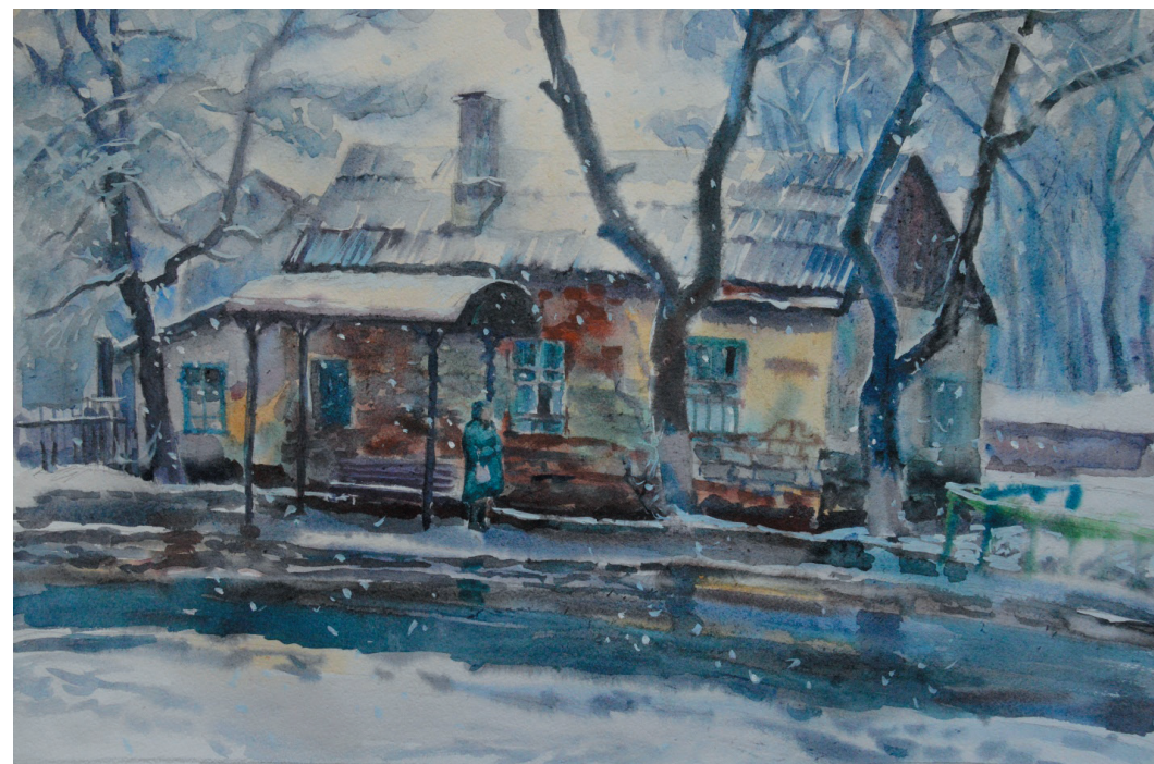
Первый снег. Бум., акв. 39x57. 2014 г.