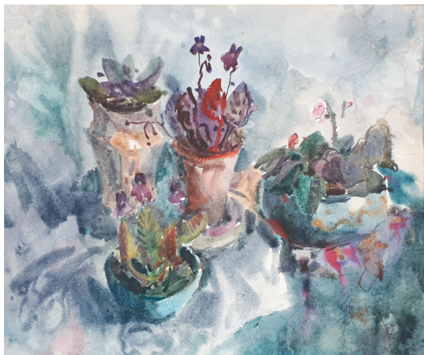
Фиалки. Бум., акв. 42x50. 1998 г.