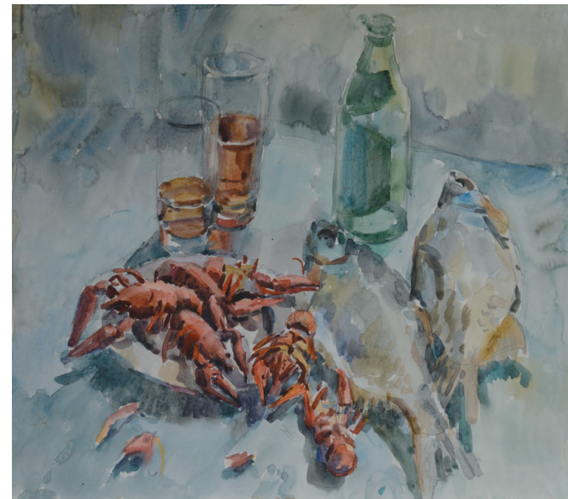
Натюрморт. Бум., акв. 45x60. 1997 г.