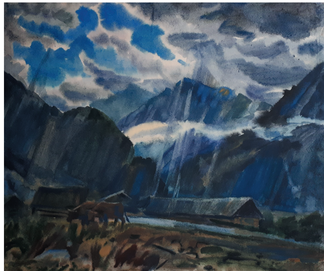
Гроза. Бум., акв. 55x68. 2019 г.