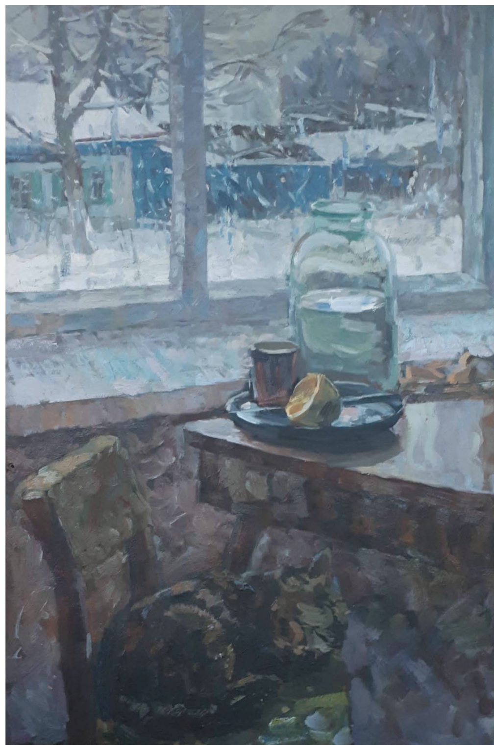
Зима. Х., м. 45x69. 2002 г.