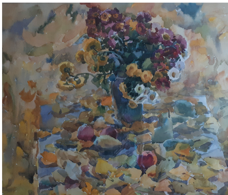
Листопад. Бум., акв. 46x55. 2018 г.