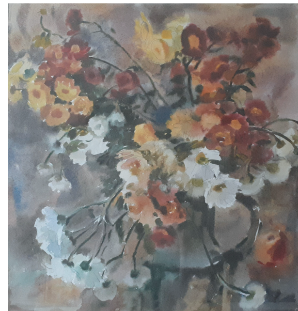
Осенний букет. Бум., акв. 42x43. 2010 г.