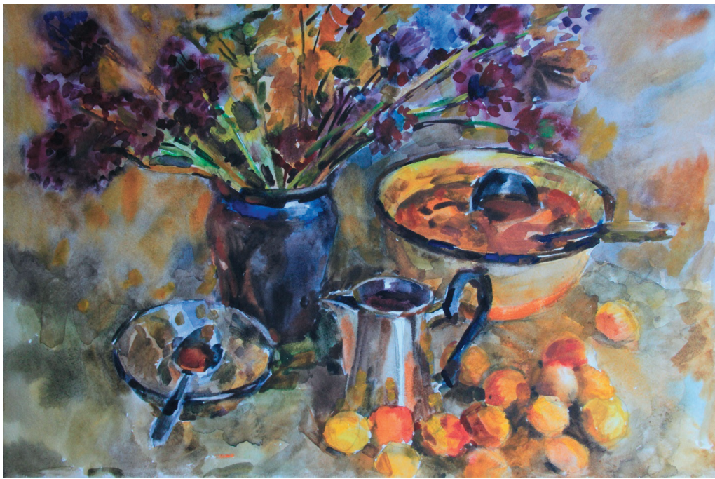
Абрикосовое варенье. Бум., акв. 40x62. 2010 г.